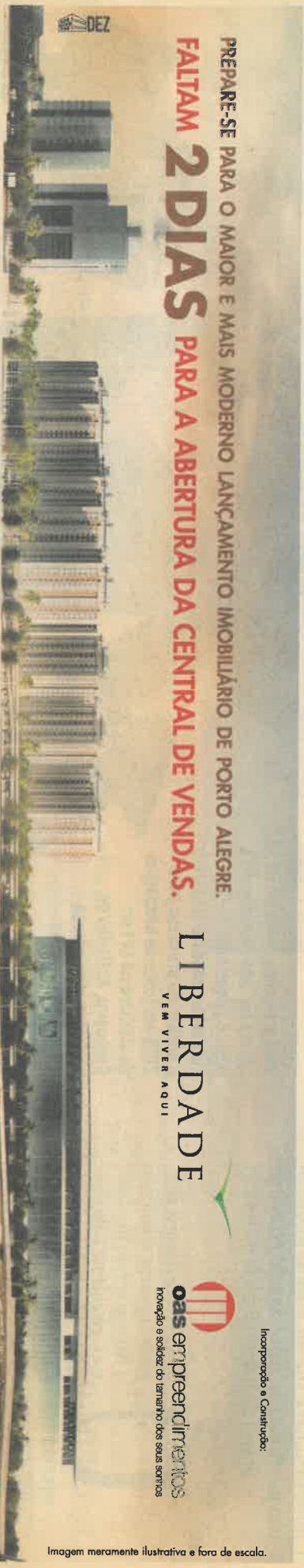
Imagem meramente ilustrativa e fora de escala.